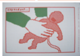
« Cependant » de Paul Cox

Pour les plus jeunes, faire une lecture de chaque image, puis faire raconter l'histoire.